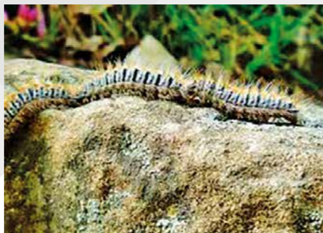
Procession de chenille

L'insecticide biologique à base de Bacillus thuringiensis (BT) est spécifique des chenilles. Il est efficace contre les chenilles aux 3 premiers stades car il est actif lors de l'ingestion. Le recours aux insecticides de synthèse n'est pas recommandé.